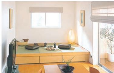
▲洋室の一部に畳空間を演出Panasonic “畳が丘”

小上がりの高さは、30cmであれば、洋室のリビングと隣りあわせていても椅子に座った人と和室で座った人の目の高さが同じぐらいになりますので自然に生活ができます。車