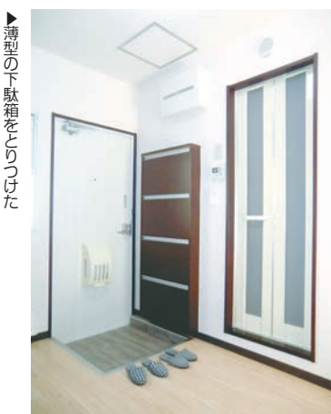
▲薄型の下駄箱をとりつけた

「ある程度がいていたので、バスルームの2点ユニット以外は全て取りかえしました」(高野社長) 施工費は237万円、賃料は施工前より1万円高いた。また、下駄箱のなかつた。